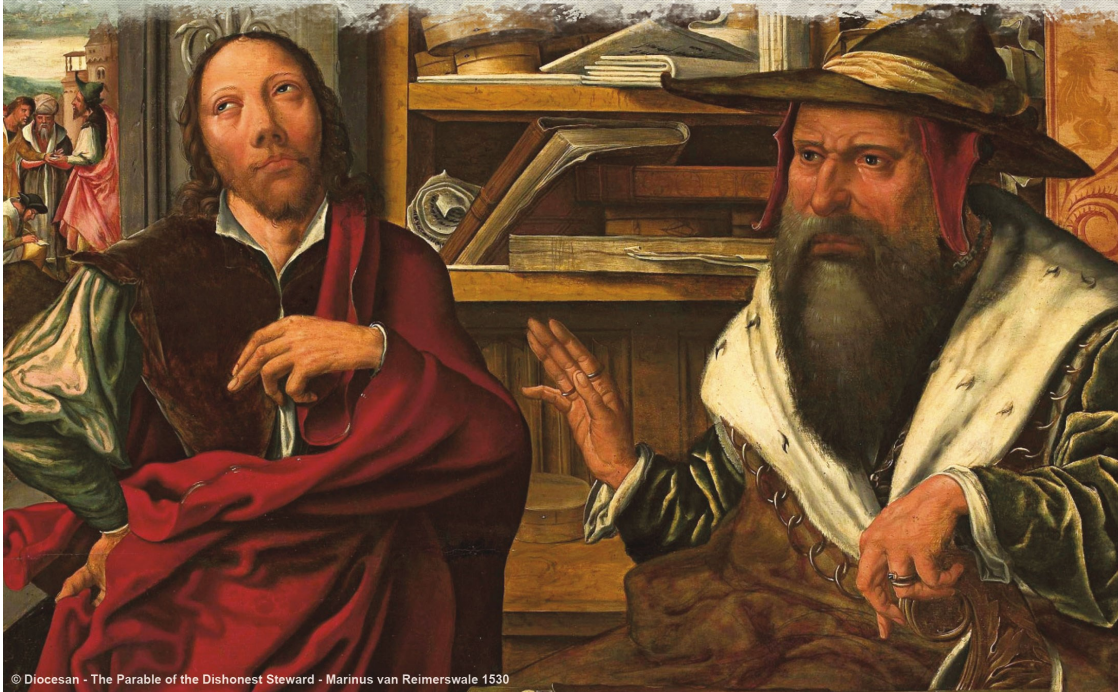
© Diocesan - The Parable of the Dishonest Steward - Marinus van Reimerswale 1530