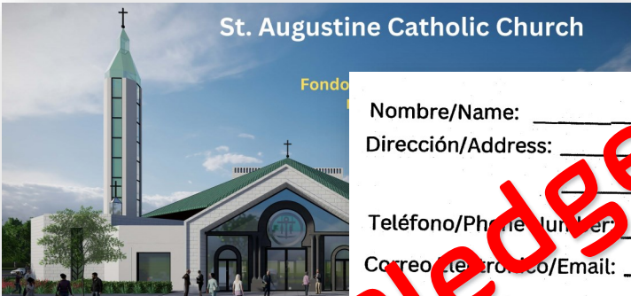
St. Augustine Catholic Church